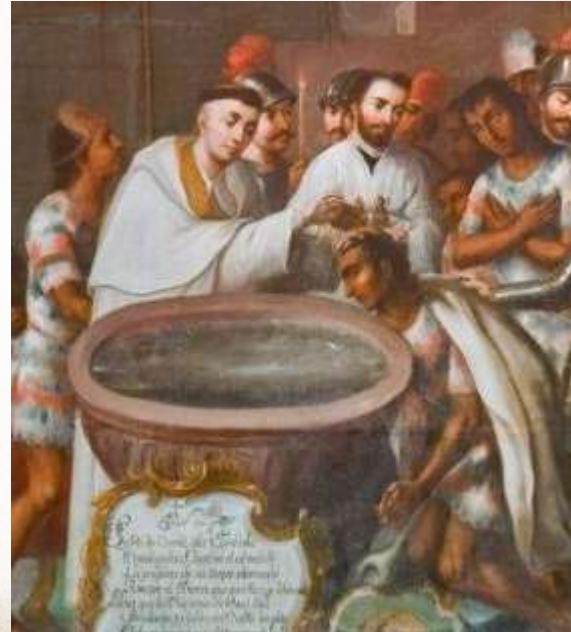
comunes en fiestas patronales