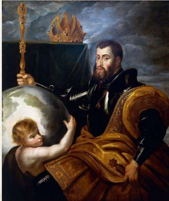
Corrida celebrada por El nac. De Felipe II